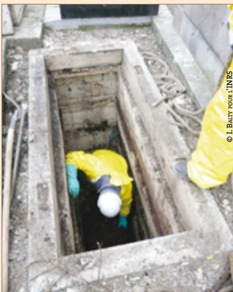
Photo 2 : prise d'appui sur des redans pour descendre dans le caveau.

Une plaque en tôle est d'abord retirée. Il n'y a pas d'eau dans la tombe, ce que les fossoyeurs attribuent à la présence d'arbres dans le cimetière qui drainent le sol. Quatre cercueils sont empilés, séparés par des dalles en ciment qui seront cassés à la barre à mine. Tout d'abord les restes de bois du premier cercueil sont retirés. Une seule personne descend. Il ne reste du corps que les os qui sont déposés à la main dans une bassine en plastique. La « terre » et les débris sont ensuite ramassés à la pelle et déposés dans une autre bassine. L'opération est répétée pour les cercueils suivants. Les ossements sont soigneusement regroupés dans une petite boîte en bois qui sera transférée vers un ossuaire. Le quatrième et dernier cercueil est métallique. Les formulaires détenus par la conservatrice en chef n'en indiquent pas la raison. Selon elle, il s'agit plus probablement d'un transfert avant inhumation que d'un décès par maladie contagieuse. Le cercueil doit être sorti à l'aide de cordes et d'un crochet.