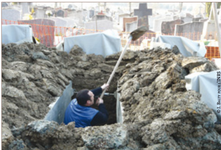
Creusement manuel d'une sépulture en pleine terre.

Fossoyeur / risque biologique / risque chimique / rayonnement ionisant / évaluation des risques.