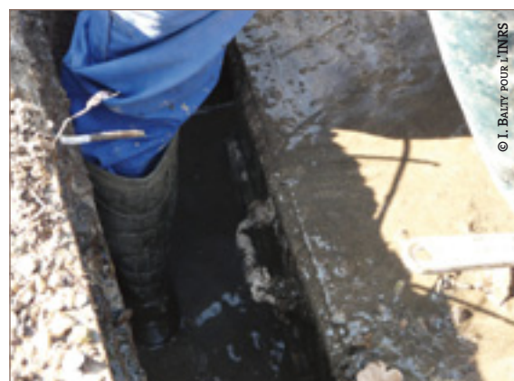
Risque de blessure avec les ferrallages.

● Il est possible de réduire en partie ce risque par la mécanisation (engins de levage et maintenance), quand la largeur des allées le permet. La modification progressive de l'agencement des cimetières devrait faciliter l'accès des engins au plus près des tombes. Cette exigence devrait être prise en compte lors de la conception d'un nouveau cimetière.